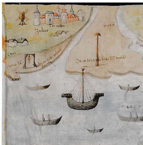
Kaart van Tholen met afbeelding van een kogge.

Door veranderende stromingen, mede als gevolg van inpolderingen en ontwateringen in verband met de zoutnering, verzandde de Striene maar schuurde de loop van de huidige Eendracht steeds verder uit. Tussen 1220 en 1223 werd in een brede boog ten oosten, noorden en zuiden van Schakerloo de Vijftienhonderdgemetenpolder aangedijkt. Deze polder werd aanvankelijk Nieuw-Schakerloo genoemd. Door deze inpoldering lag het 'bloeiende dorp Schakerloo' niet meer aan een doorgaand vaarwater en werd daarmee een 'lantdorp' dat bekend kwam te staan onder de naam van het 'Oudeland van Schakerloo'. Daarmee kwam er ook een eind aan de 'geleidetol' op deze plaats. Op het kruispunt van de Henetrecht (Eendracht) met de bocht van de Schelde werd nu op de dijkbocht van de nieuwe zeedijk een stenen 'Tholhuys' gebouwd. Daarmee werd de tol van Schakerloo vervangen en kreeg Tholen haar naam.