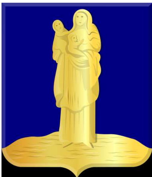
Wapen van Sint-Annaland