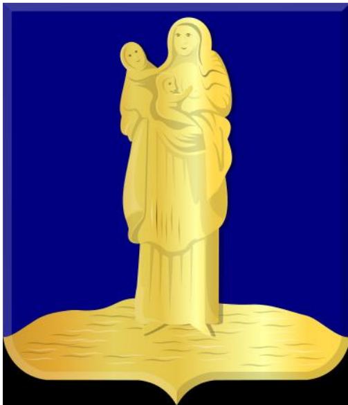
Wapen van Sint-Annaland