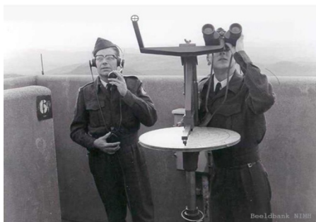
Luchtwachters op post.

Website: www.luchtwachtorens.nl . Twitter: @luchtwachtKLD .